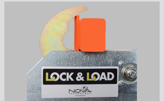
Engages reinforced RIG bars with 4 1/2-inch vertical center plates