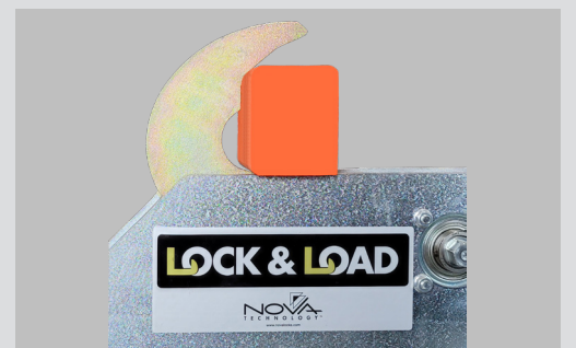
Secures standard trailers and any vehicle with an open RIG bar