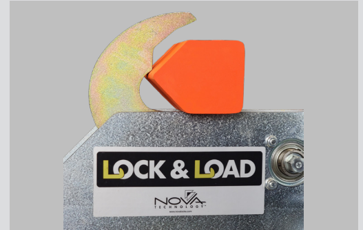
Designed to secure pentagonal RIG bars